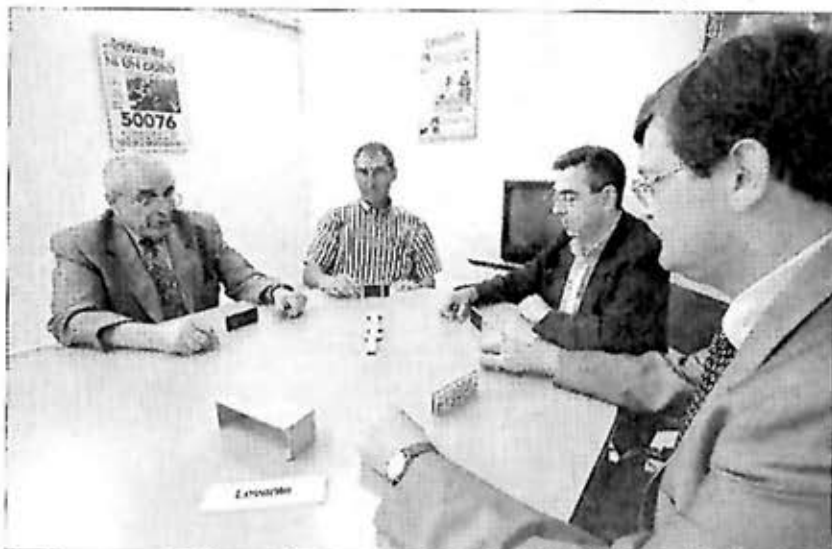
Las fichas del juego que regala el periódico son de primera calidad.